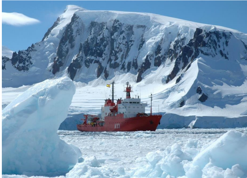
Buque Oceanográfico Hespérides en la Antártida.